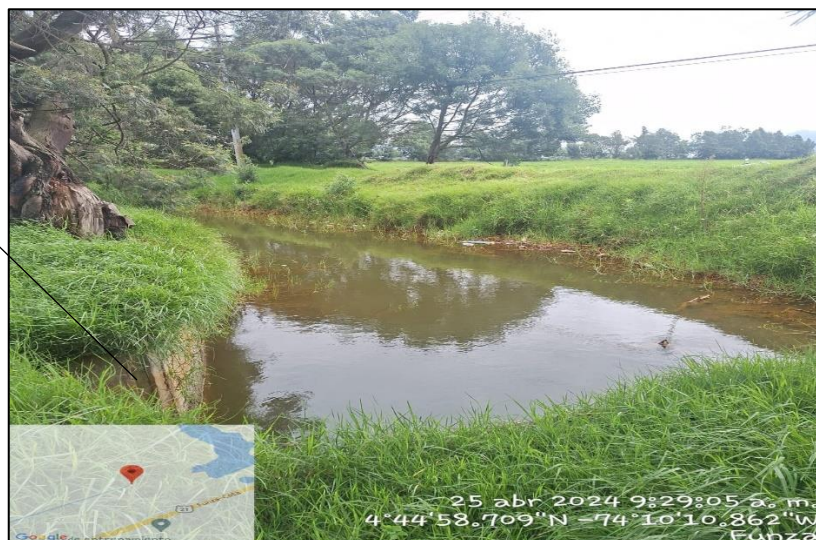
Ilustración 4. Entrada Vallado