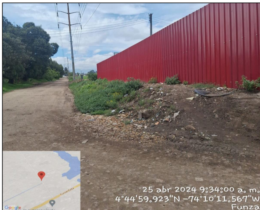
Ilustración 6. Movimiento de tierra para conformación de carretable sin influir en el canal Isla Galicia

C.P. 250020 Tel. +57(1) 823 40 70 823 40 71 / 823 40 73 Fax. + 57(1) 825 76 20 Dir. Cra. 14 No. 13-05