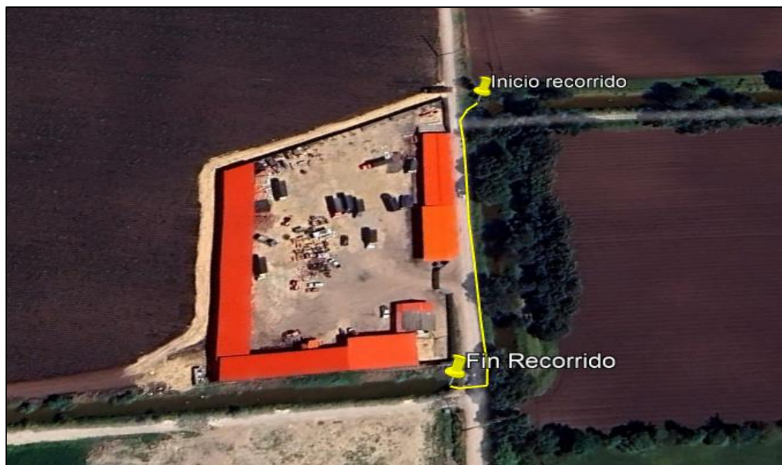
Ilustración 3. Recorrido

Con la finalidad de identificar presunto relleno en el canal Isla Galicia, se realizó recorrido desde las coordenadas 4°45'2.818" N - 74°10'12.882" W hasta las coordenadas 4°44'58.538"N - 74°10'11.092"W (Ver ruta amarilla-ilustración 3).