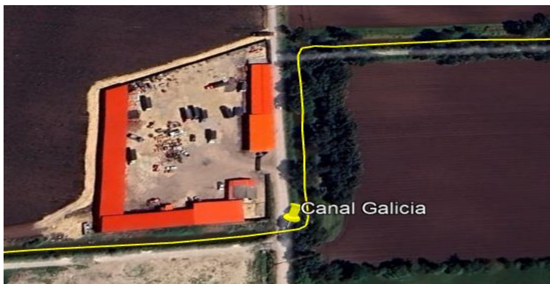
Ilustración 1. Ubicación Canal Isla Galicia

Teniendo en cuenta que ante el municipio de Funza se interpuso queja por presunto relleno en el vallado Galicia, el día 25 de abril del 2024 personal adscrito a la Secretaría de Ambiente y Bienestar Animal realizó inspección, de conformidad con el acta de visita ambiental No. 054, en el canal Isla Galicia ubicado en vereda la Isla (ver ilustración 1), coordenadas 4^{\circ}44'58.784'' N y 74^{\circ}10'10.887'' W, como se muestra en la ilustración 2: