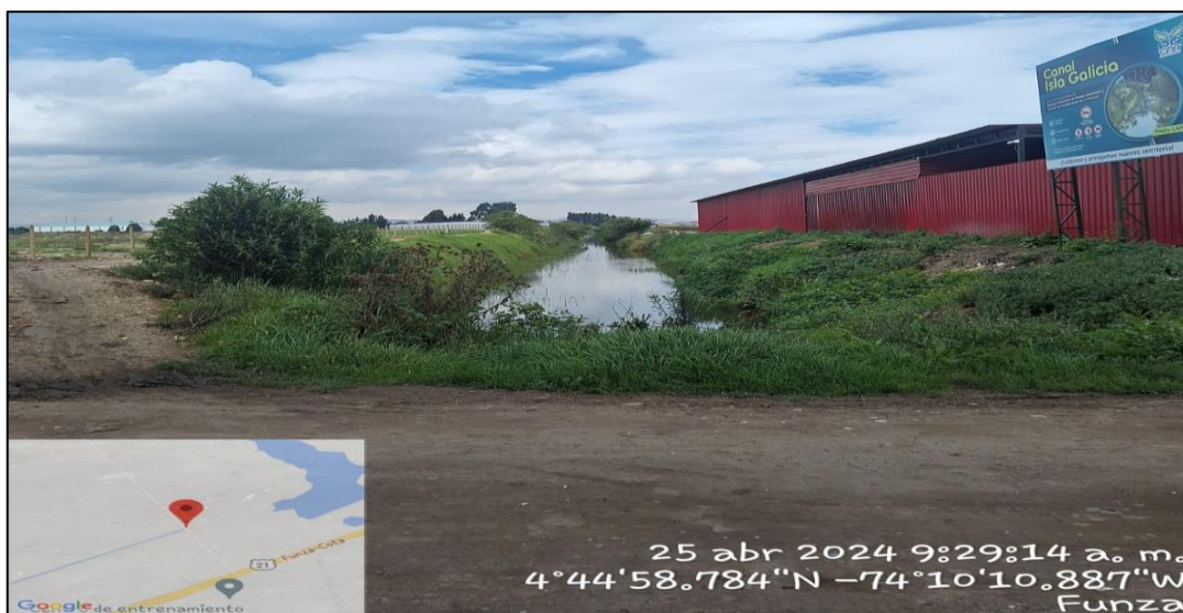
Ilustración 2. Canal Isla Galicia